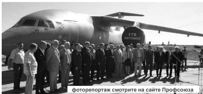
фоторепортаж смотрите на сайте Профсоюза